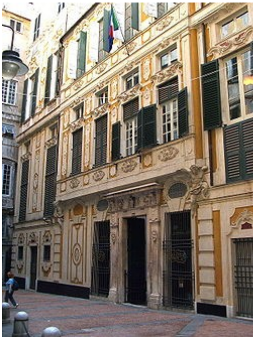
Palazzo Spinola di Pellicceria