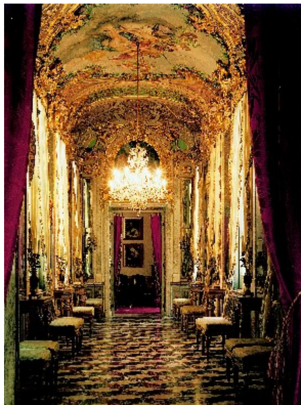
La galleria degli Specchi

Il palazzo Spinola di Pellicceria o palazzo Francesco Grimaldi è un edificio sito in piazza di Pellicceria al civico 1 nel centro storico di Genova, inserito il 13 luglio del 2006 nella lista tra i 42 palazzi iscritti ai Rolli di Genova divenuti in tale data Patrimonio dell'umanità dall'UNESCO.